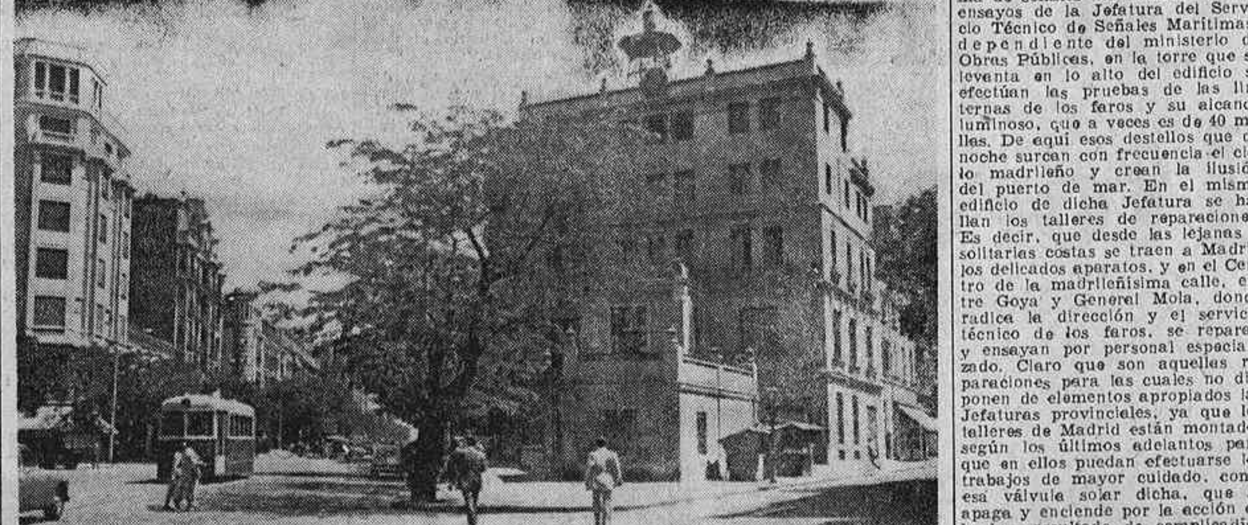
En la calle de Alcalá, por encima de las olendas de tejados y cúpulas, se levanta este faro marítimo, un auténtico faro como los que señalan a las costas y orientan a los navegantes. En él se ensayan las linternas en reparación. De aquí los destellos que muchas noches surcan el cielo de ese "Madrid, puerto de mar", y que a veces tienen un alcance de 40 millas.

Contamos con radiofaros y faros de válvula solar y, sobre todo, con una buena técnica en señales para la navegación marítima y aérea