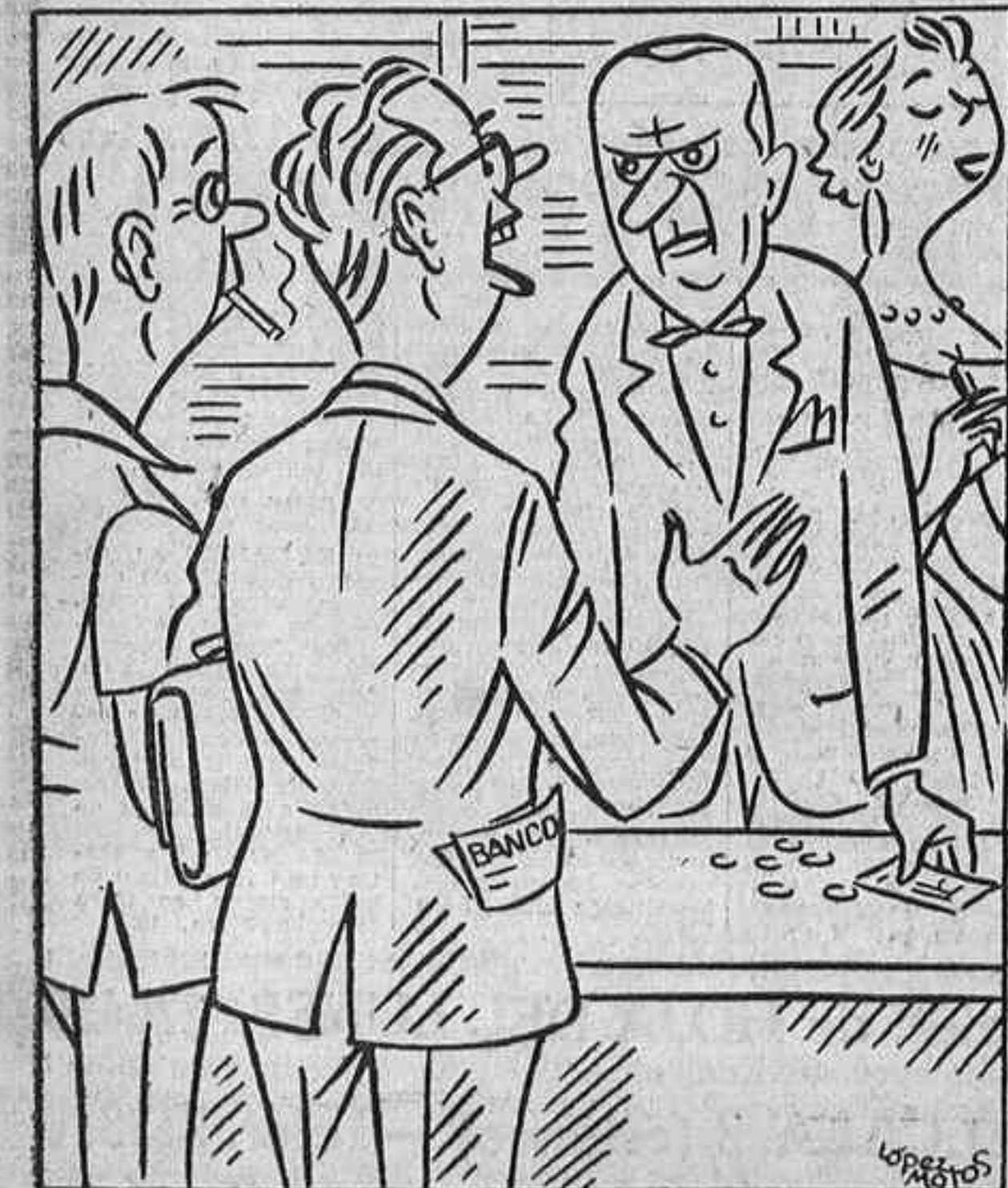
—Deme "caldito de gallina" de los huevos de oro.